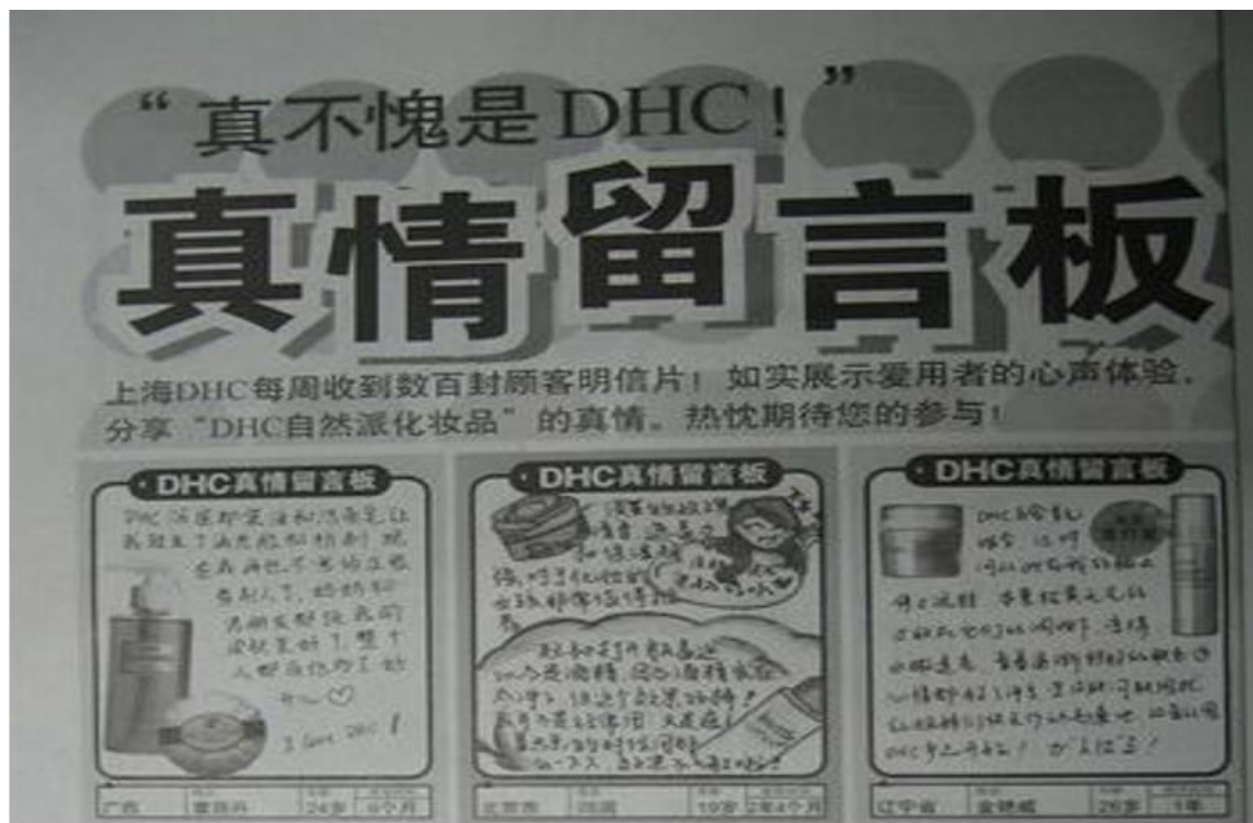
图 DHC 的“真情留言板”

所以，DHC 在试用装后面，又附加了一项非常重要的说服工具，如下图所示的“真情留言板”：